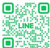
・公式LINEアカウント

※LINEで登録できるのは、 1アカウント限定となります。 ご家族が利用される場合は FRESH画面(URL)から 直接入力ください